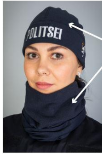
Talvine müts ja talvine torusall