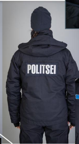
Jopet on võimalik ühildada soojendusvoodriga või tuulejakiga. Tooted on omavahel ühendatavad esiosa lukuga. Turja peal on truck-kinnitus ning jope sees küünarvarre osas truck-kinnitus soojendusvoodri fikseerimiseks.