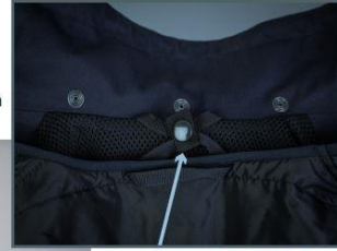
Kapuuts on truckidega eemaldatav.